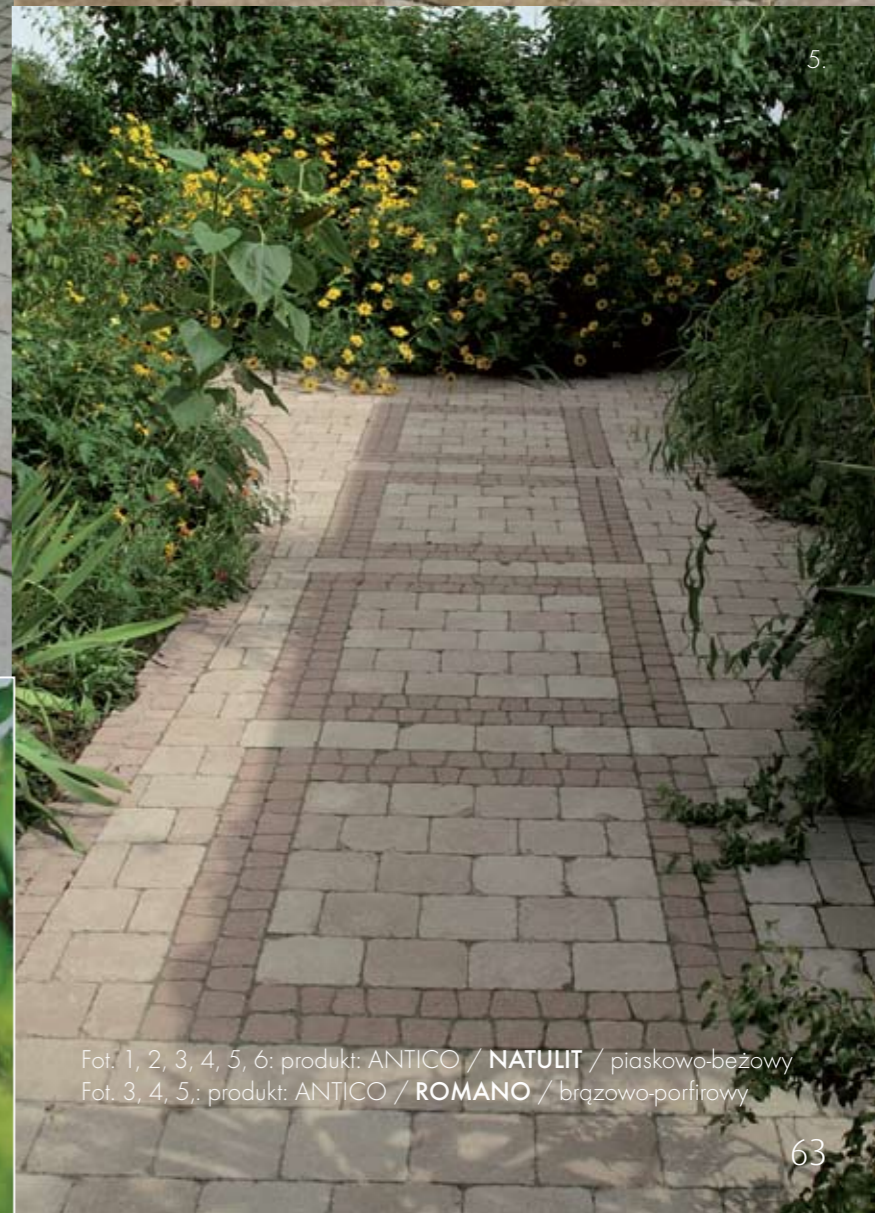
Fot. 1, 2, 3, 4, 5, 6: produkt: ANTICO / NATULIT / piaskowo-beżowy Fot. 3, 4, 5: produkt: ANTICO / ROMANO / brązowo-porfirowy