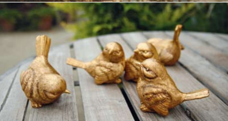
Tylko małe wróble, stali bywalcy ogrodu, nie czują powagi sytuacji.