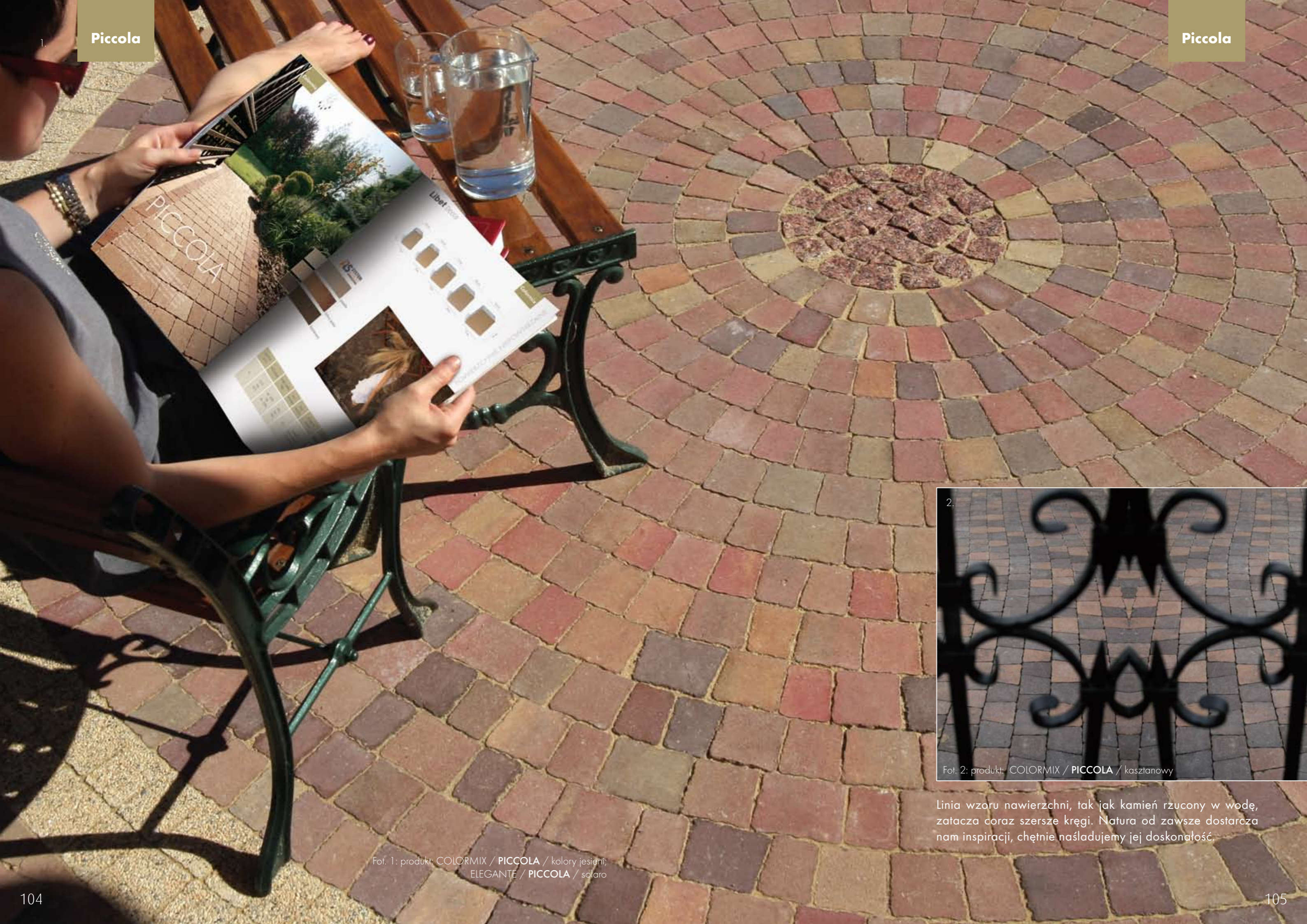
Fot. 1: produkt: COLORMIX / PICCOLA / kolory jesieni; ELEGANTE / PICCOLA / solaro