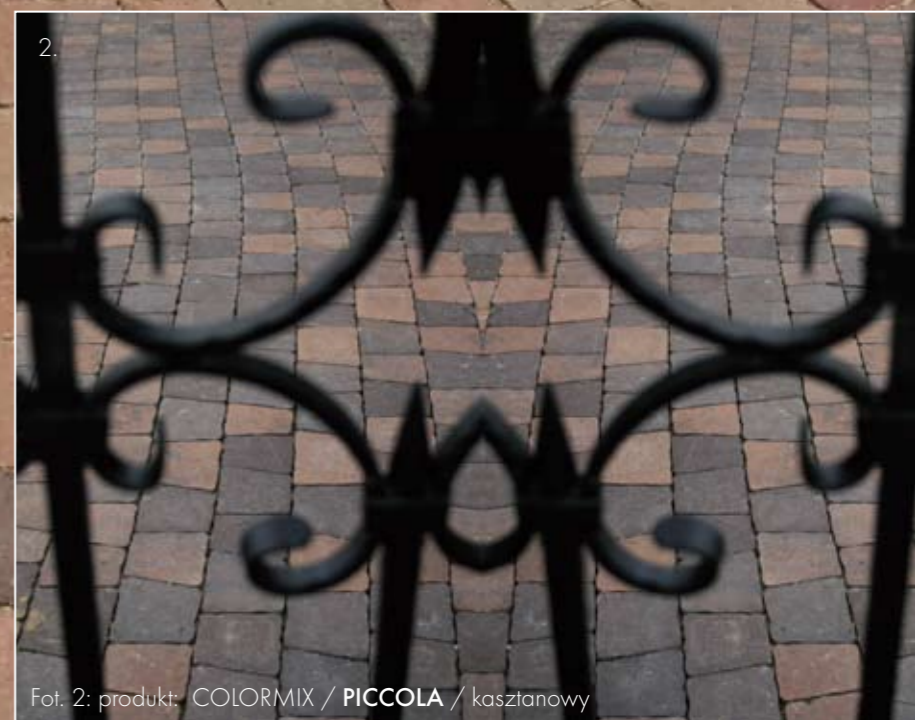
Fot. 2: produkt: COLORMIX / PICCOLA / kasztanowy

Linia wzoru nawierzchni, tak jak kamień rzucony w wodę, zatacza coraz szersze kręgi. Natura od zawsze dostarcza nam inspiracji, chętnie naśladowujemy jej doskonałość.