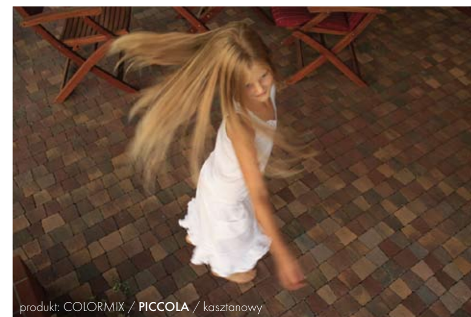
produkt: COLORMIX / PICCOLA / kasztanowy