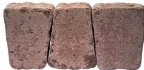
Szlachetna kostka brukowa Romano z grupy Antico podkreśla charakter aranżacji w stylu vintage, nowoczesnym nadaje eklektycznego wdzięku.