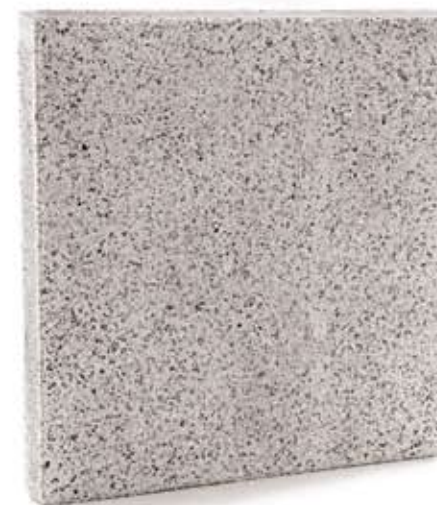
Płyty Monza Elegante . Duże, proste formy i geometryczne wzory. Zaprojektowane, by kreować modne patia i eleganckie tarasy.