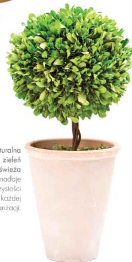
Naturalna zieleń odświeża i nadaje soczystości każdej aranżacji.