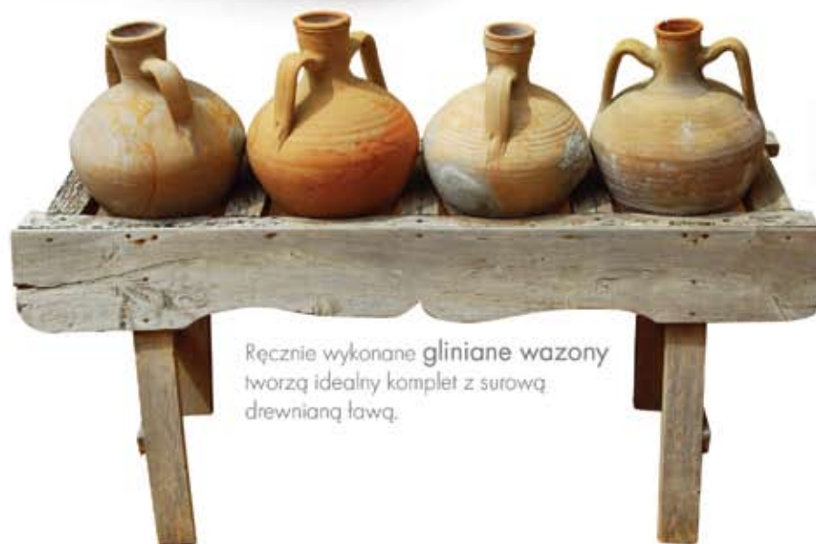
Ręcznie wykonane gliniane wazonny tworzą idealny komplet z surową drewnianą ławą.