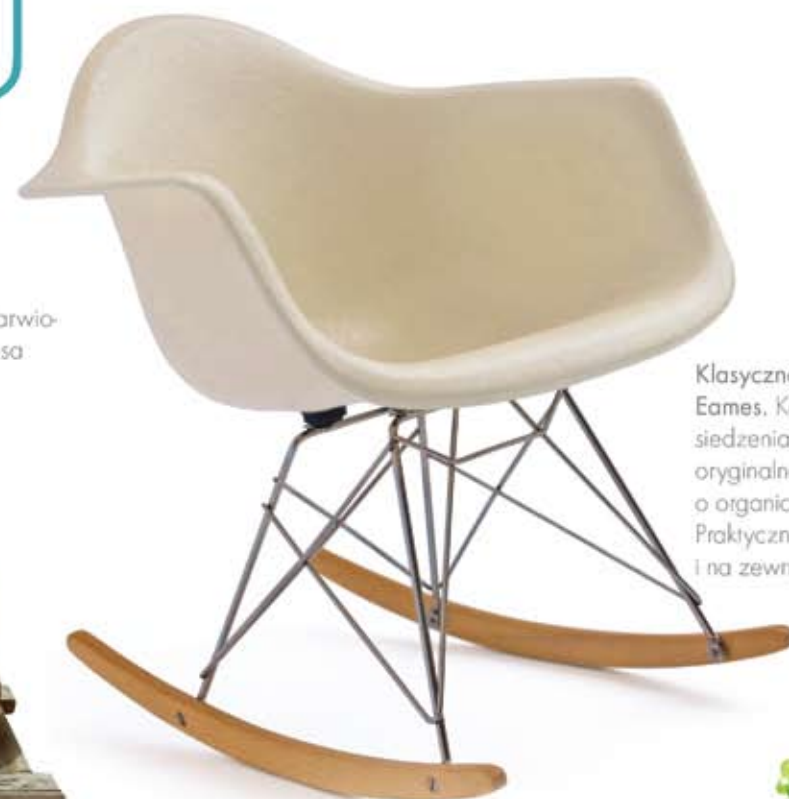
Klasyczne krzesło Eames. Komfort siedzenia zapewnia oryginalne siedzisko o organicznym kształcie. Praktyczne wewnątrz i na zewnątrz.