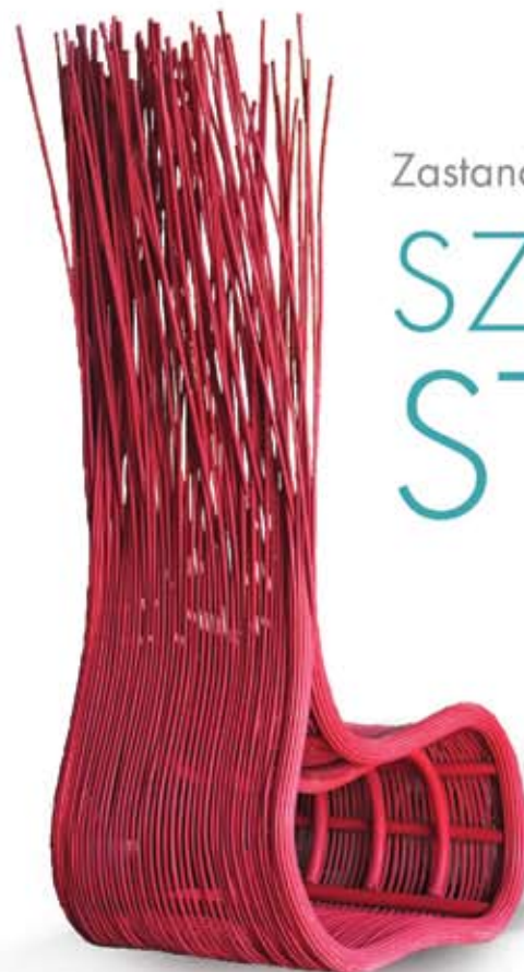
Fotel Yoda, wyplatany z barwnego na czerwono bambusa na stalowej konstrukcji.