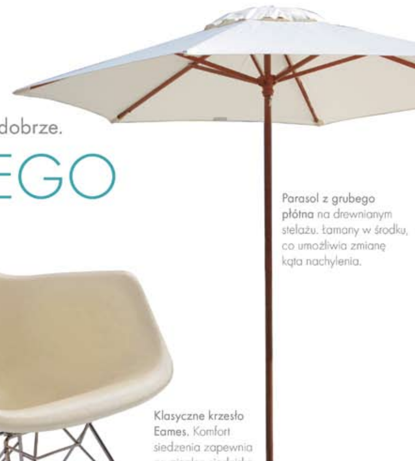
Parasol z grubego płótna na drewnianym stelażu. Łamany w środku, co umożliwia zmianę kąta nachylenia.