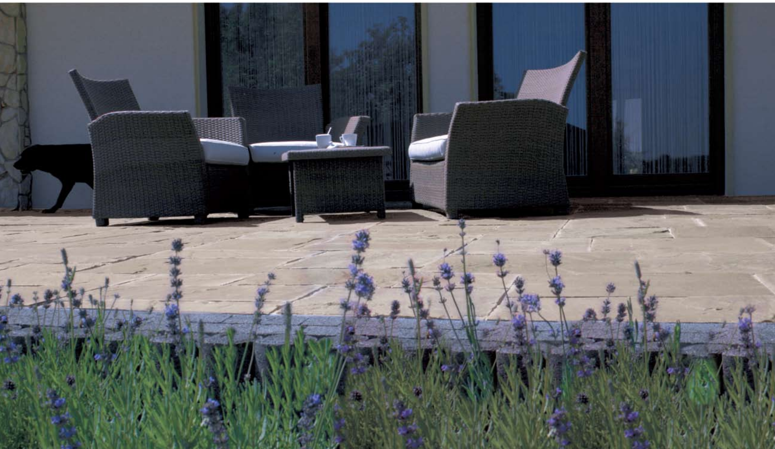
Libet PATIO / SHERIDAN / mint