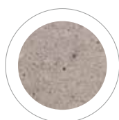
POPIELATY COLOR FLEX