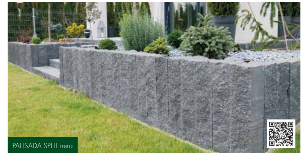
PALISADA SPLIT nero

Akcent nowoczesności znajdziemy w systemie Maxima. Tworzy go siedem kolekcji płyt tarasowych, których nowoczesny styl można dodatkowo uzupełnić o funkcjonalne stopnie schodowe oraz bloki ogrodzeniowe. Każdy z produktów posiada własny, niepowtarzalny wyróżnik, dzięki któremu może składać się na atrakcyjne, samodzielne nawierzchnie (np. smukły kształt Maxima Slim, Molto i Lungo, imponujące gabaryty Maxima i Maxima Grande czy charakterystyczna imitacja fugi na powierzchni Maxima Rigato i Maxima Trio). Jednocześnie wszystkie są względem siebie komplementarne.