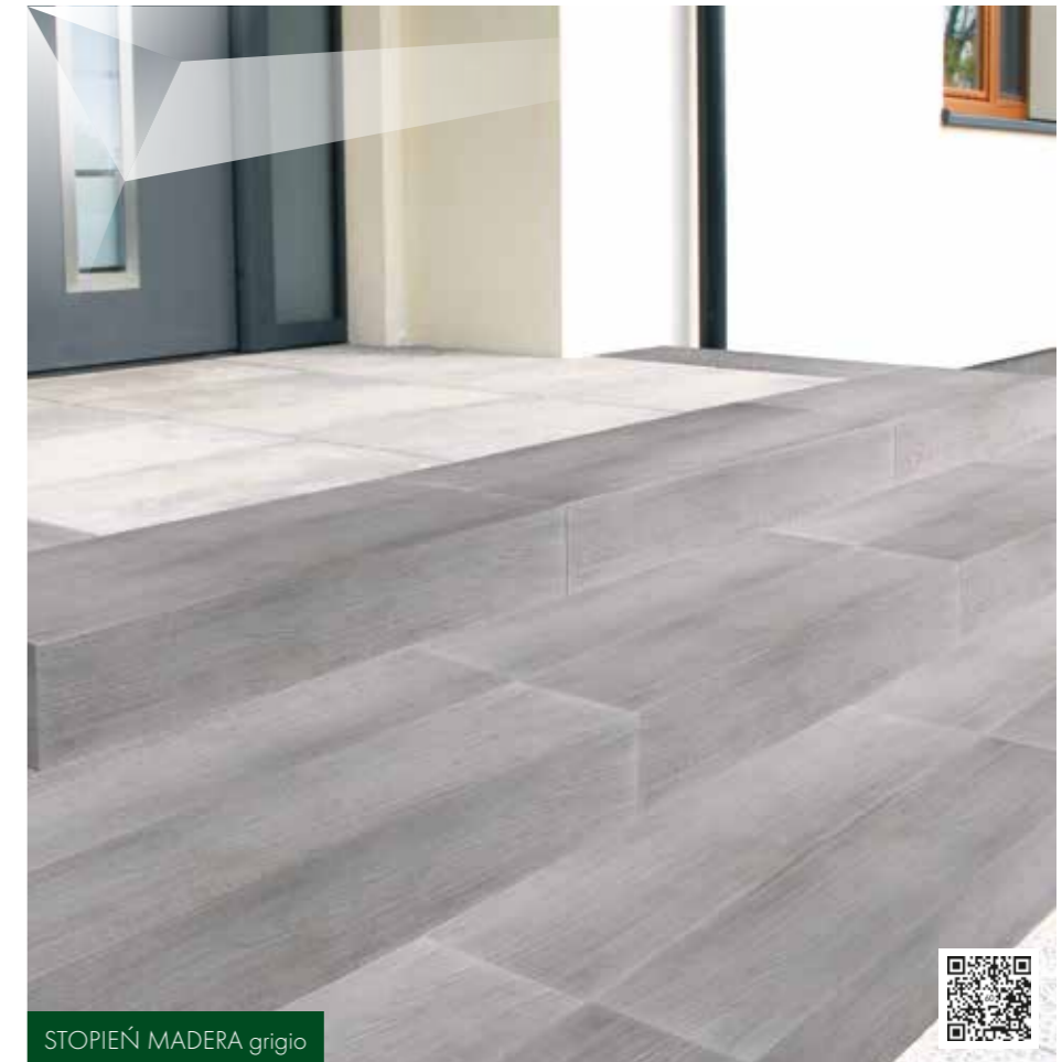
STOPIEŃ MADERA grigio