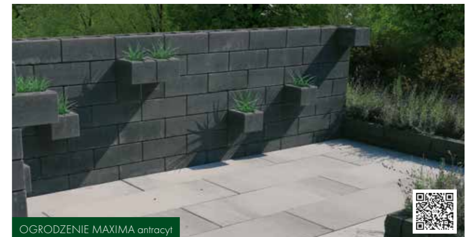
OGRODZENIE MAXIMA antracyt