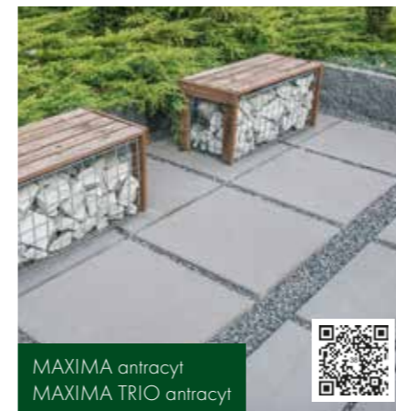
MAXIMA antracyt MAXIMA TRIO antracyt

Ponadczasowy urok świata przyrody odzwierciedlają płyty, palisady i stopnie schodowe Madera (efekt drewna) oraz Trawertyn (kamień). Nawiązanie do tradycyjnych, naturalnych wzorców widoczne jest również w elementach splitowanych, na które składają się: stopień, palisada, ogrodzenie, cegła. Wyróżnia je nieregularna krawędź boczna, uzyskana w procesie łamania, dzięki której nawiązują one do wyglądu kamienia i doskonale komponują się z ogrodową zielenią.