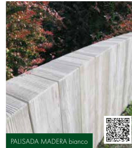
PALISADA MADERA bianco

Aranżacja przydomowej przestrzeni to poważne przedsięwzięcie, wymagające podjęcia szeregu przemyślanych decyzji, zapewniających funkcjonalny i spójny efekt całości. Nieocenione ułatwienie w jego realizacji stanowią materiały wykończeniowe, oferowane w formie jednolitych, systemowych rozwiązań.